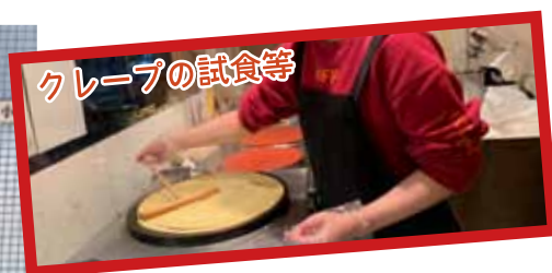
クレープの試食等