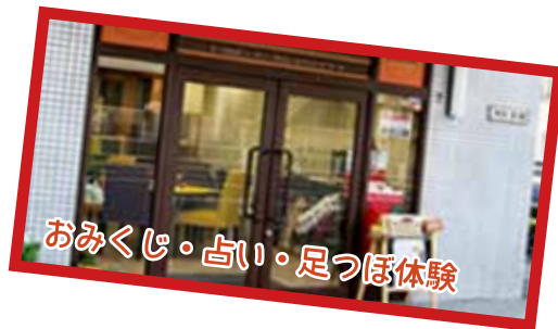
おみくじ・占い・足つぼ体験