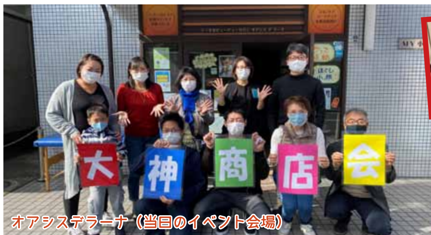
オアシスデラーナ (当日のイベント会場)