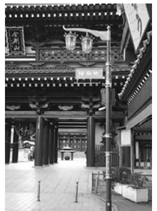
川崎大師仲見世通りでは街路灯をリニューアルしました