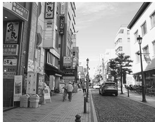
茅ヶ崎銀座商興会では防犯カメラの修繕などを行いました