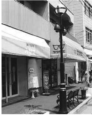
逗子市池田通り商店会では、電線地中化に伴う街路灯を新しくしました。安心安全のまちづくりで防犯カメラを街路灯に共架しています