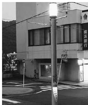
湯河原駅前通り明店街では、既設片側アーケードを撤去して街路灯を新設しました。商店街名を柱に表示したLED光源による投光照明です。近い将来、電線地中化されます