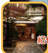
紀伊国屋旅館で海の幸ランチ