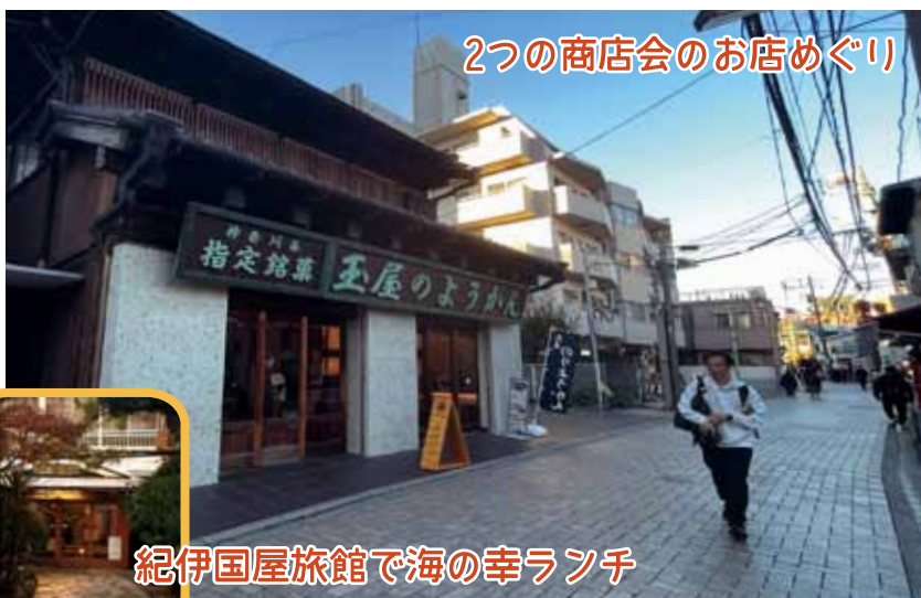
2つの商店会のお店めぐり