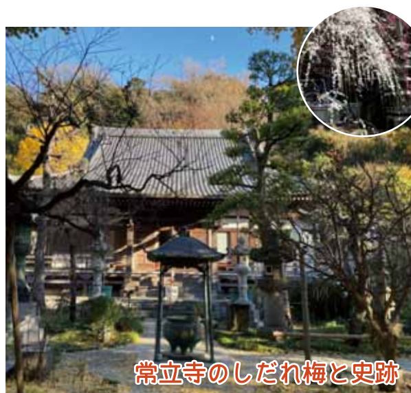
常立寺のしだれ梅と史跡