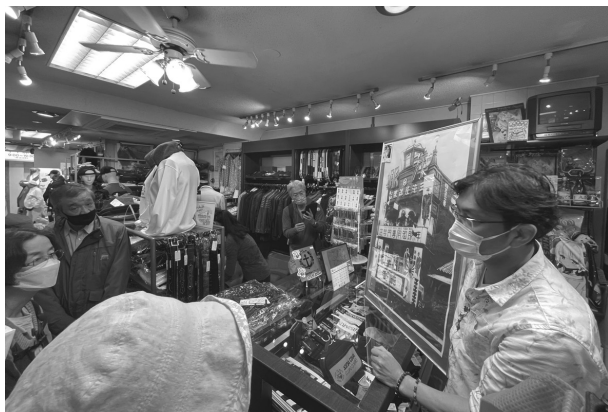
商店街ツアーは少人数開催やオンラインなど、その商店街の希望するやり方で出来ます

募集を開始している事業もあります。お気軽にお問い合わせください。 事務局・045-633-5184