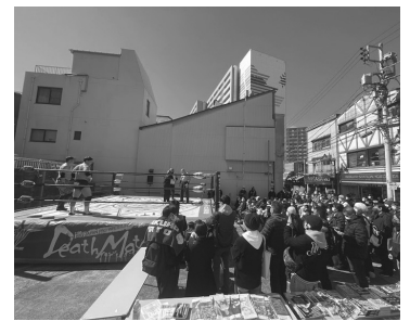
2月26日に横須賀市で行われた「大日本プロレスinドブ板通り商店街」でも、商連かながわから副賞のお米券を提供させていただきました