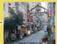
はまポン体験 野毛の名店の メニューを堪能