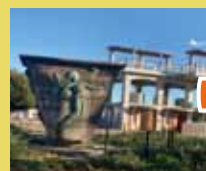
野毛山公園 オリンピック記念碑 など史跡と眺望