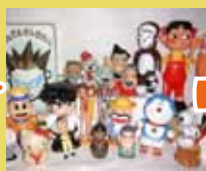
ひばり像と昭和堂 昭和の懐かしい 玩具や品物