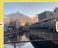
野毛商店街 写真映えする スポットを紹介