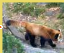
野毛山動物園 園内の見学ポイント にもご案内