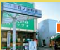
日ノ出町駅 集合場所 ここからスタート