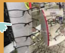
メガネの美和 品揃え豊富 手話も勉強中