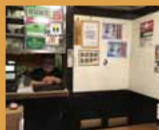
角よし 元気な親子の お蕎麦屋さん