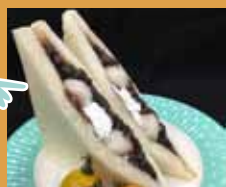
グローバルフーズ お惣菜とサンド ウィッチのお店