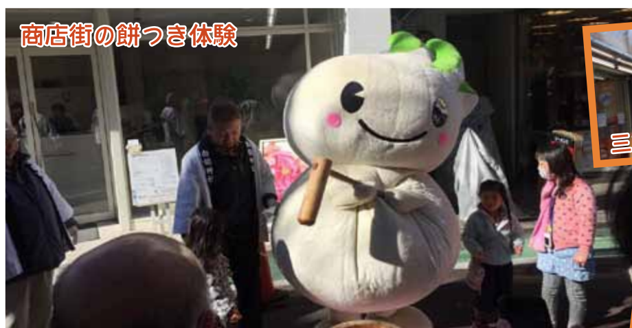
商店街の餅つき体験