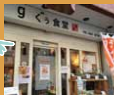
旬菜 ぐう食堂 身体に優しい地場 野菜を使う飲食店