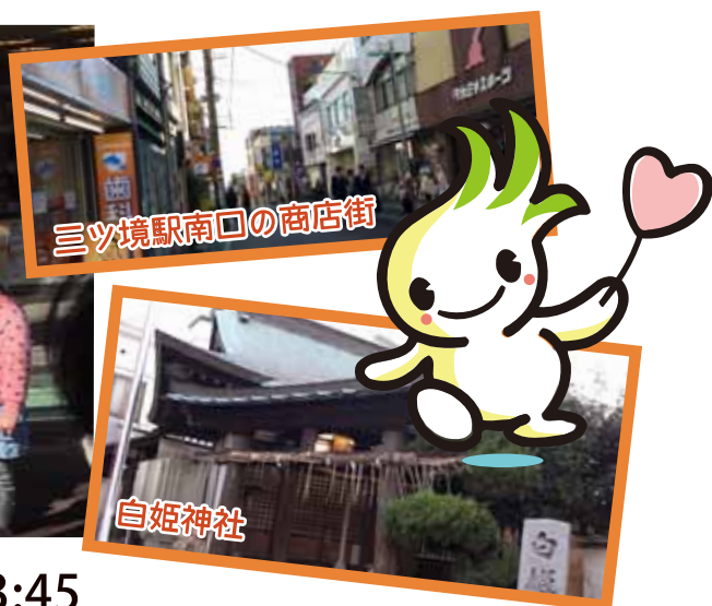
三ツ境駅南口の商店街