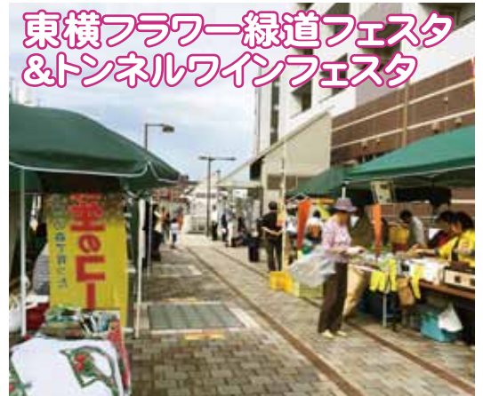
東横フラワー緑道フェスタ & トンネルワインフェスタ