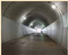
東横フラワー緑道 旧東急線の線路跡 イベントも開催中