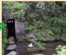
旧東海道付近 大綱金比羅神社や 浮世絵の風景