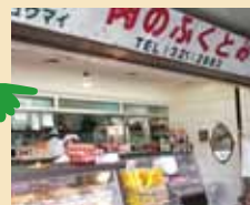
商店街のお店巡り 個性的な飲食店や 新しいお店も紹介