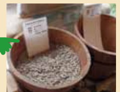
試食と試飲 コロッケ試食や コーヒーの試飲も