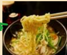
各自でランチ ラーメンストリート 和食や中華もあり