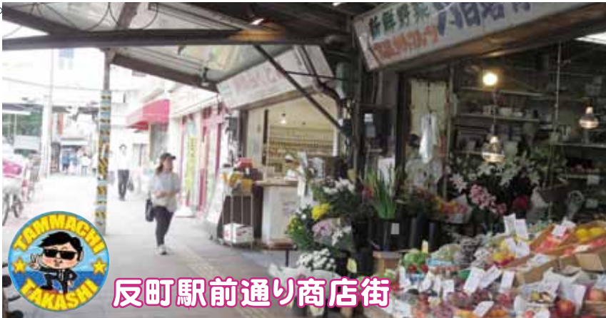
反町駅前通り商店街