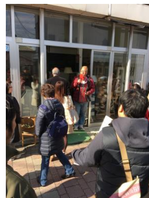
ガイド付商店街散策