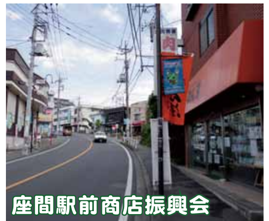
座間駅前商店振興会