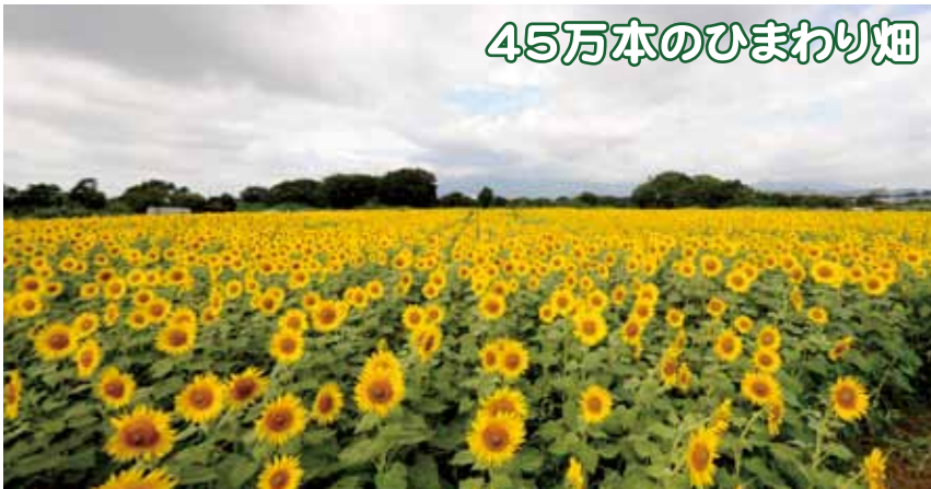
45万本のひまわり畑