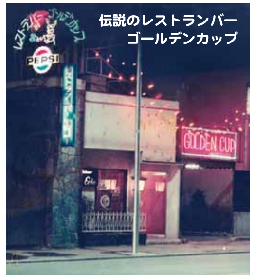
伝説のレストランバー ゴールデンカップ

本牧リボンファンストリート商店会～本牧1丁目東商友会～本郷町商栄会、三つの商店街を巡ります