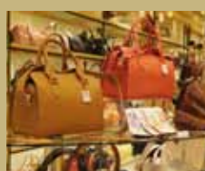
キタムラ ブランドの歴史 について