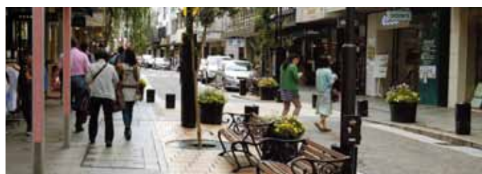
元町ショッピングストリート