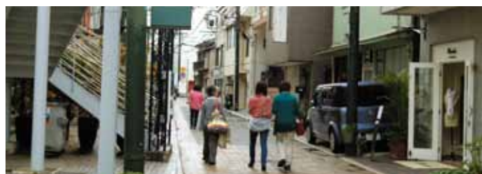
元町クラフトマンシップストリート