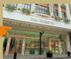
スタージュエリー 店内見学と 元町とお店の話