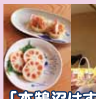
「本鵠沼はす池通り物語」のお店訪問