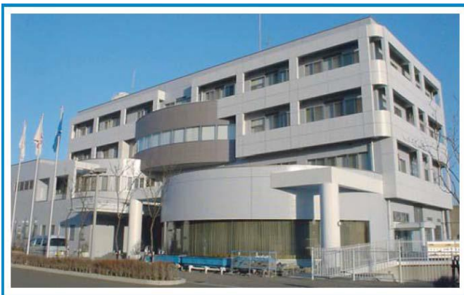
○神奈川県水産技術センター