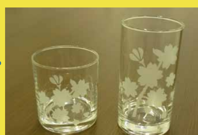
コップ作成(イメージ)