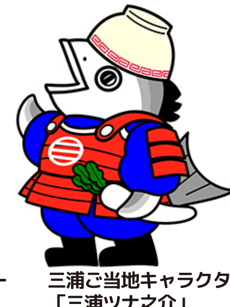
三浦ご当地キャラクター「三浦ツナ之介」