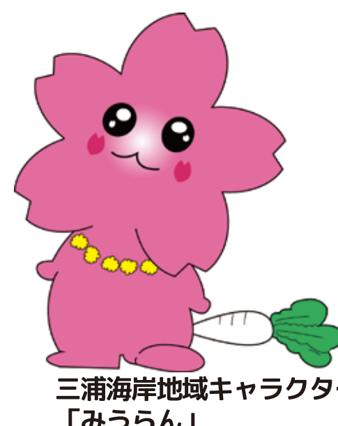
三浦海岸地域キャラクター「みうらん」