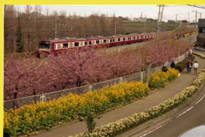
三浦海岸の河津桜(イメージ)