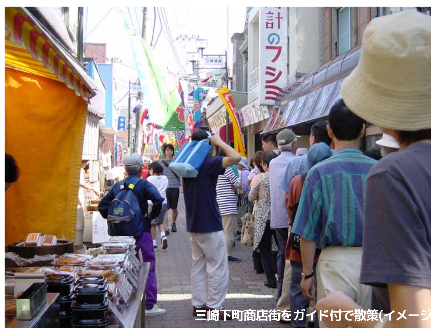
三崎下町商店街をガイド付で散策(イメージ)