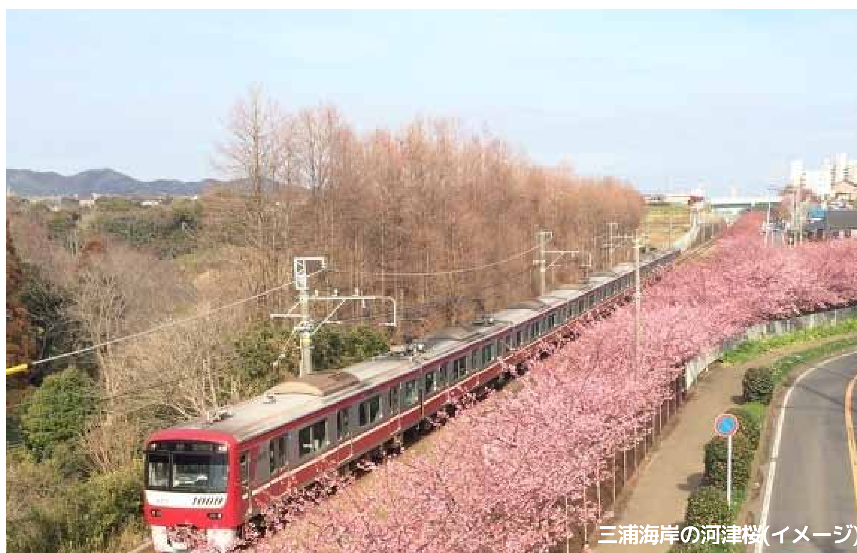
三浦海岸の河津桜(イメージ)

* ランチは三崎の名物まぐろ料理を堪能！ 産直センターでの海産物のお買い物や、ガラス工芸体験もご用意。一足先に三浦海岸で春を楽しんでみませんか？