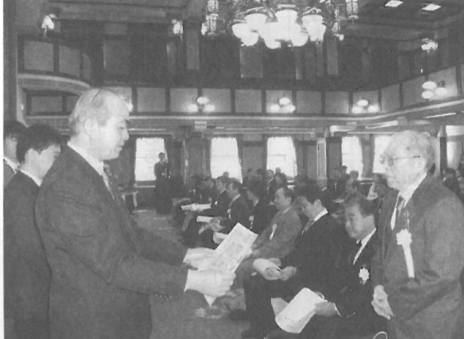
受賞者には小野義博副知事が表彰状を手渡した。

問い合わせ先 県商業観光流通課商業振興班 TEL●045-210-5609 URL●http://www.pref.kanagawa.jp/osirase/syokan/syogyo/hyosyo/hyosyo.html