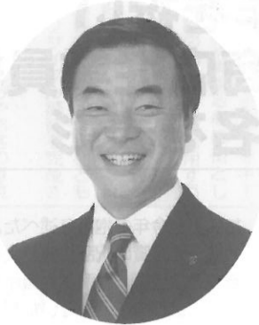
神奈川県知事 松沢 成文