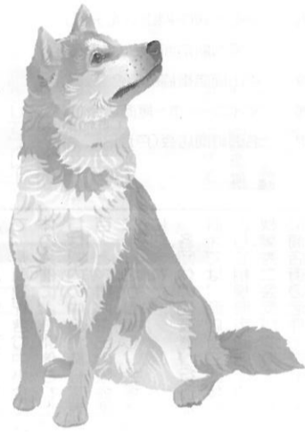
川崎市中原区 モトスミ・ブルー・ダン通り商店街 の「モトスミ」の犬

会員並びに関係者の皆様、新 年明けましておめでとうござい ます。平成十八年の新春を迎え 謹んで年頭のご挨拶を申し上げます。 昨年は景気回復が本格化し消 費活動が活発になってきたと報 道され、ようやく日本経済が明 るさを取り戻してきた年とし ました。しかし残念ながら我々中小 商業者にとっては、まだまだそ の美観が持てない厳しい状態が 続いています。 一方で、昨年は、まちづくり