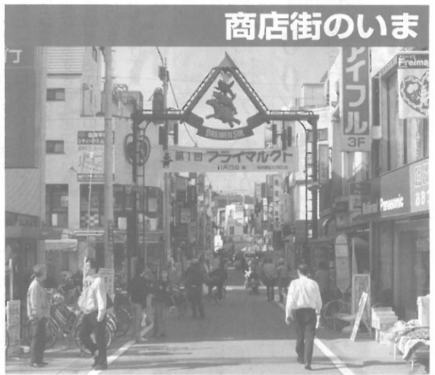
モトスミ・ブレーメン通り商店街振興組合 〈川崎市中原区〉

モトスミ・ブレーメン通りと言えば、新聞・メディアにもたびたび登場し、活性化している商店街事例の常連とも言える存在である。環境に優しいエコ活動や、国際交流事業などでも知られ、「とても真似できない」と思われていることもしばしば。その商店街が、今度は街路のハード整備を完了させた。この長引く不況の中で、なぜこのような思いきった大規模整備に踏み切ったのか、そもそも、なぜこの商店街が活性化しているのか。商店街のリーダー達に話を聞き、活性化に必要なものは一体何なのか探った。