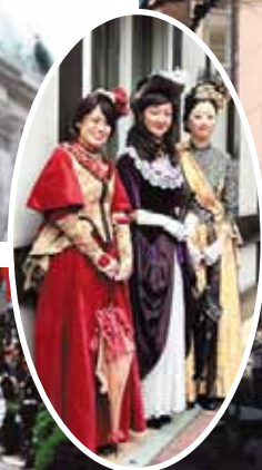
(イベント時の様子)