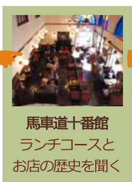
馬車道十番館 ランチコースと お店の歴史を聞く