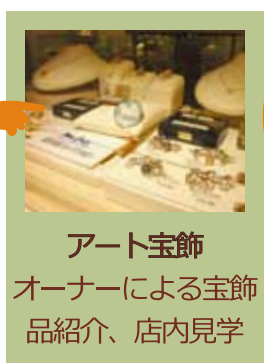
アート宝飾 オーナーによる宝飾 品紹介、店内見学