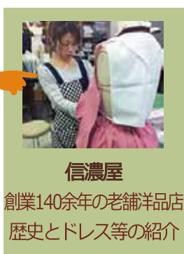
信濃屋 創業140余年の老舗洋品店 歴史とドレス等の紹介