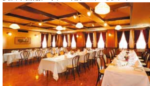
横浜十番館ディナー用フロアでランチ