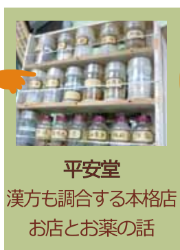
平安堂 漢方も調合する本格店 お店とお薬の話