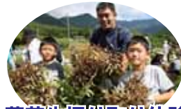
落花生掘り取り体験！