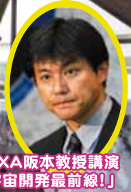
JAXA 阪本教授講演 「宇宙開発最前線！」