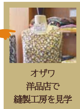
オザワ 洋品店で 縫製工房を見学