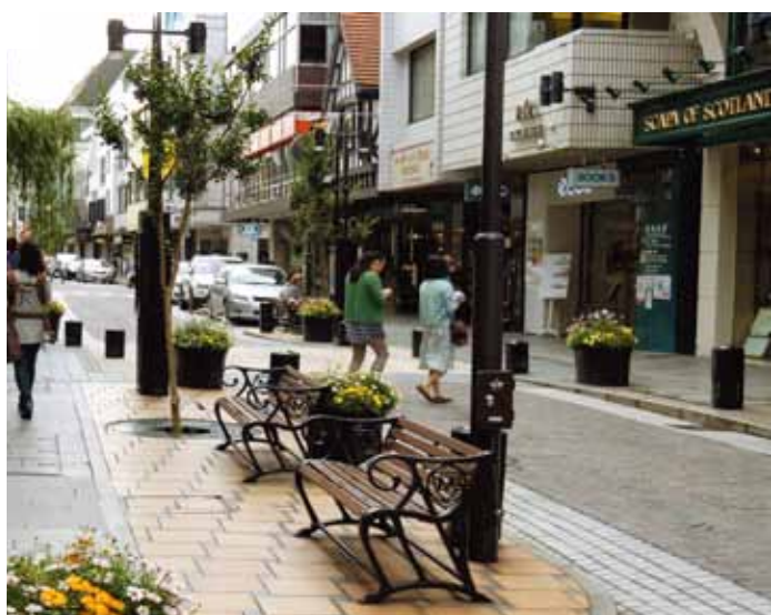
元町ショッピングストリート

横浜を代表する元町商店街。伝統を守り元町ブランドを受け継ぐお店や個性豊かなお店。街の成り立ちなどの歴史を聞きながら、元町通りと仲通りの5つの商店を巡りオーナーと触れ合い、フレンチレストランでのランチを楽しむ商店街ツアーです。