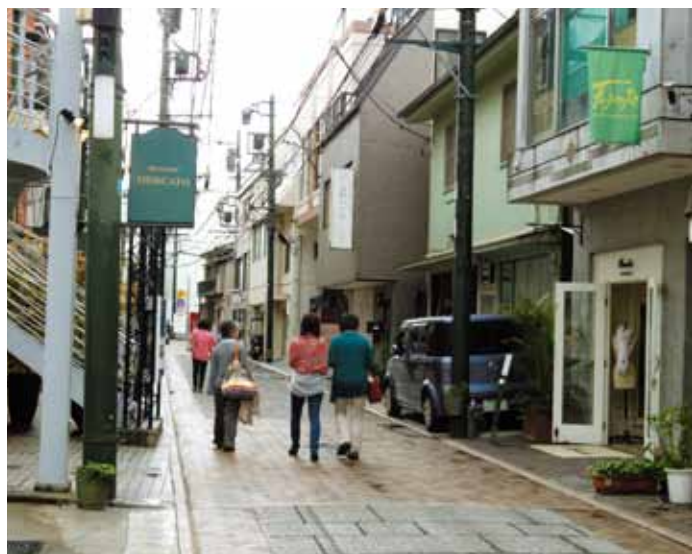
元町クラフトマンシップストリート