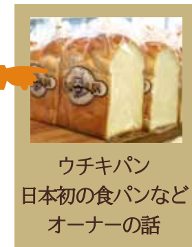
ウチキパン 日本初の食パンなど オーナーの話