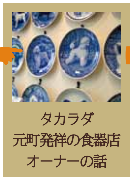
タカラダ 元町発祥の食器店 オーナーの話