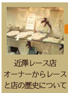
近澤レース店 オーナーからレース と店の歴史について